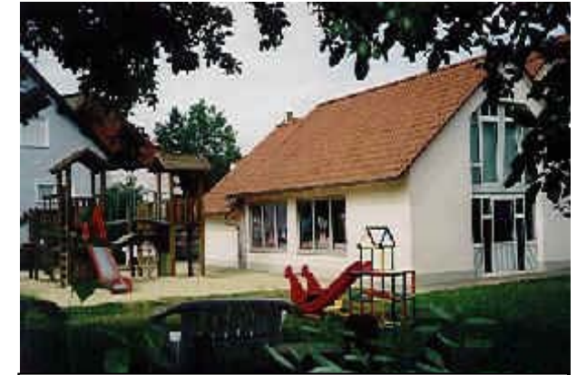
Soll in Kürze U3-gerecht werden: Die Kita St. Elisabeth

Hierzu hat das Land Hessen 90.000 Euro für Modernisierungsmaßnahmen zur Verfügung gestellt, zum neuen Kita-Jahr sollen dann 10 U3-Plätze zur Verfügung stehen. Bisher waren es lediglich 5 mit Sondergenehmigung.